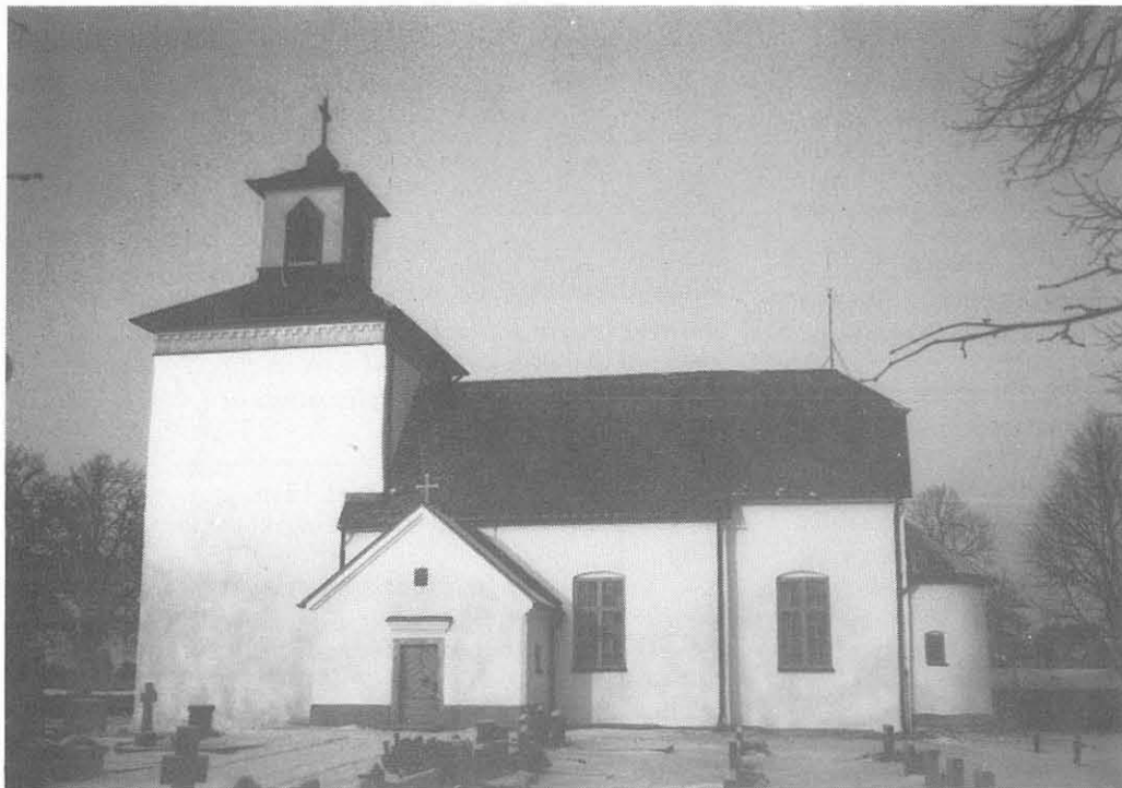
Skeby kyrka 1985.