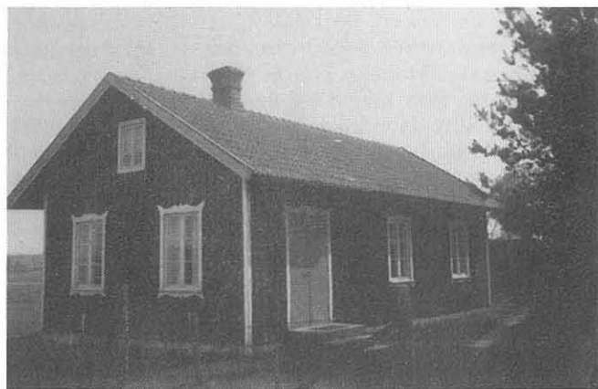
Missionshuset på 50-talet. Huset var blåbandslokal i början.

Ett viktigt möte på sommaren var "Kaffefästen". Vid en sådan 1901 deltog 96 personer förutom de medverkande från Lidköpings barnkör. De första åren hyrde föreningen lokaler av Källby Missionsförsamling i Järneklev.