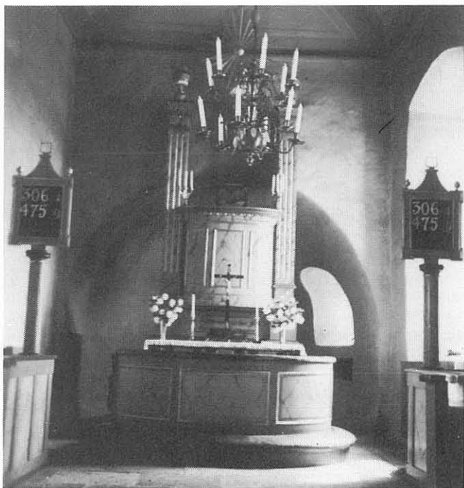
Koret med predikstolsaltaret på 1950-talet.

Men det vore dock olyckligt om sena tidens Skeby-bor skulle bibringas den uppfattningen, att predikstolen flyttats till sin nuvarande plats av respektlöshet för altarets helgd. Så är säkerligen ingalunda fallet! Trots den mellan 1699–1701 byggda läktaren, räckte ändå inte utrymmet till i kyrkan. På den tiden var det kyrkoplikt, så några personer från varje hushåll måste för att undgå plikt till kyrkan övervara gudstjänsterna. Befolkningen växte, och Skebyborna stod inför problemet, att skaffa ytterligare platser i kyrkan. De fann det vara både billigare och enklare att flytta predikstolen, för att på så sätt ytterligare få plats för några bänkrader. Västerplana kyrka t.ex. hade måst bygga ett tvärskepp för att på så sätt lösa platsproblemet. Detta ställde sig givetvis betydligt dyrare, men ett visst sinne för ekonomi visade Skebyborna. Det är i samband med predikstolens flyttning som taket över koret höjts till jämnhöjd med långhusets tak, för att i koret få plats med predikstolen.