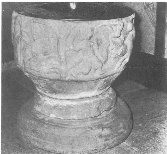
Othelricius dopfunten från 1100-talet.

Vid denna tid hittades varierande summor på upp till 15 Rdr i Skeby kyrka. Dessa summor finns upptagna i en kassabok, men ingen anmälde att de saknade pengarna. Summan av pengarna rör sig om närmare 50 Rdr.