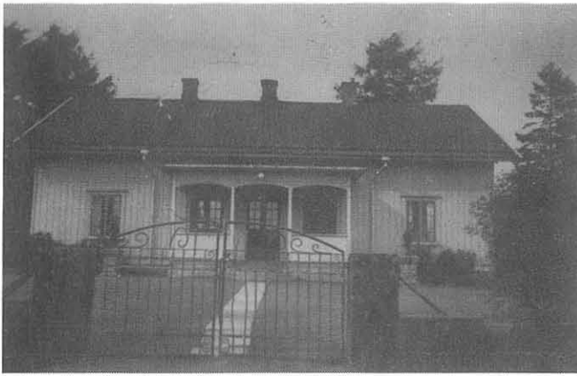
Skolhuset på 1950-talet.